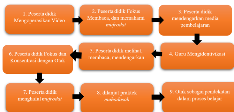
Gambar 2. Peristiwa pembelajaran Bahasa Arab Berbasis Neurosains.

Berikut adalah langkah-langkah dalam media pembelajaran bahasa Arab berbasis neurosains: