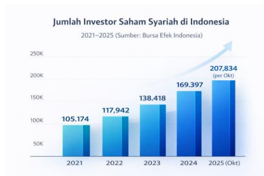
Gambar 1. Pertambahan Jumlah Investor Saham Syariah

Saham syariah merupakan sekumpulan saham dari perusahaan-perusahaan yang terdaftar di Daftar Efek Syariah dan diperdagangkan di Bursa Efek Indonesia. Selain menunjukkan bahwa investor memiliki perusahaan, saham syariah menunjukkan bahwa prinsip-prinsipnya sesuai dengan syariah (Wiranti et al., 2023). Prinsip-prinsip syariah tersebut meliputi larangan atas riba serta larangan untuk berinvestasi dalam usaha yang dinyatakan haram seperti perjudian, minuman keras, atau industri yang terkait dengan hewan yang diharamkan, dan prinsip keadilan serta transparansi dalam investasi (Dika et al., 2024). Dengan dukungan regulasi yang komprehensif dari OJK dan fatwa DSN-MUI, alat investasi ini semakin diterima sebagai pilihan investasi yang halal dan memberikan manfaat bagi masyarakat (Marpaung, 2025).